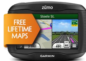
Seria zūmo 3xx