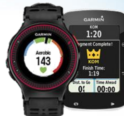
Sport & Rekreacja