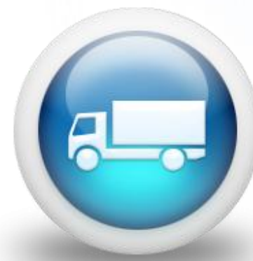
Samochody ciężarowe (dezl)