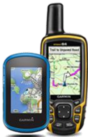
Turystyka i wędrówka