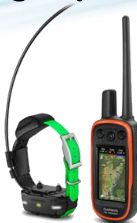
Śledzenie i trenowanie psów