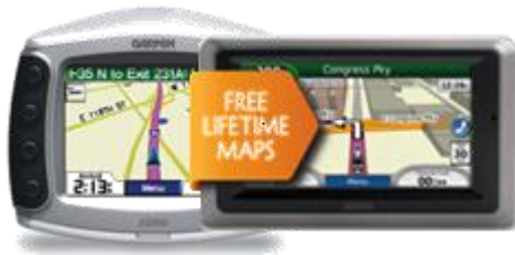
Seria zūmo 220/400/550/6xx