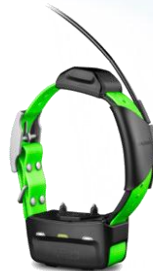
Obroża DC 50/ T 5 / TT 10 / TT 15